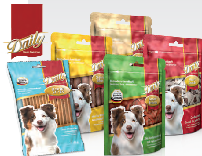
Der ideale Snack für jeden Tag

Fünf neue Snacks als Knabberspaß für Zwischendurch findet man im Fachhandel unter der Marke Daily Vario Nutrition an. Sie eignen sich besonders zur Belohnung bei Ausbildung und Training oder als Zahnpflegesnack. Die neuen Snacks sind besonders schmackhaft und leicht verträglich. Die Produkte werden nur aus ausgesuchten Zutaten in Deutschland hergestellt. Die Verpackungen sind mit einem Sichtfenster versehen und größtenteils wiederverschließbar.