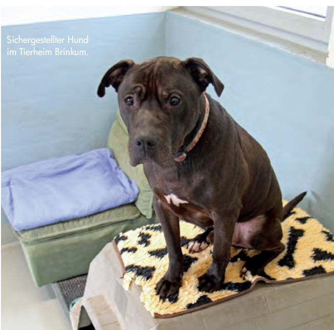
Sichergestellter Hund im Tierheim Brinkum.

Unser Dank geht an PETRA ZIPP bmt-Vorsitzende